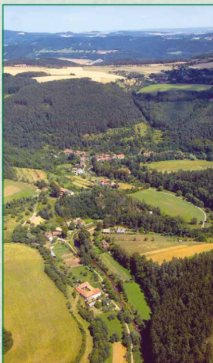
Letecký snímek obce Skryje