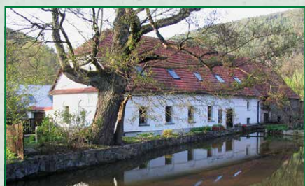
Buchalův mlýn čp. 13