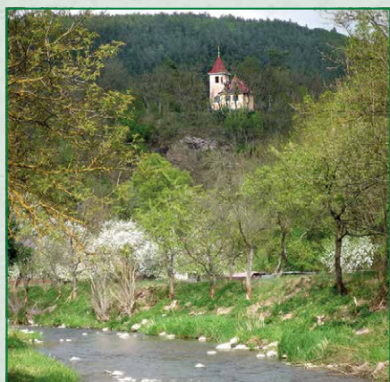
Kaplička nad řekou