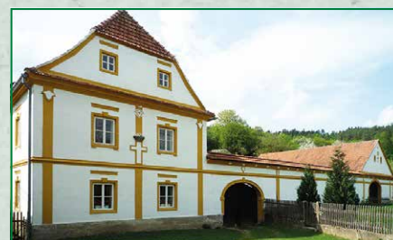
Masíčkův mlýn čp. 6